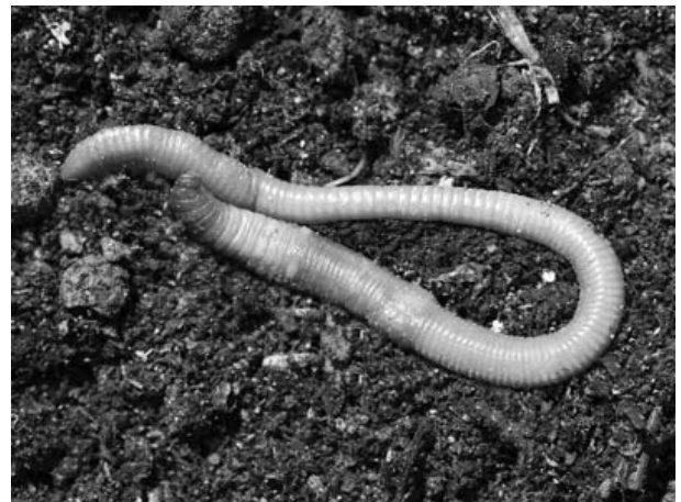
Дождевой червь обыкновенный

5 Анатолий и Виктория собрали разных животных для живого уголка. Для каждого животного им необходимо составить «паспорт», соответствующий положению этого животного в общей классификации организмов. Помогите ребятам записать в таблицу слово (словосочетания) из предложенного списка в такой последовательности, чтобы получился «паспорт» животного, изображённого на фотографии.