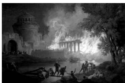
П.-Ж. Волер «Пожар в Риме» Рис. 1

2.1. Из представленных ниже репродукций картин выдающихся мировых художников выберите ту, на которой изображено протекание химической реакции.