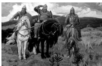
В.М. Васнецов «Три богатыря» Рис. 2