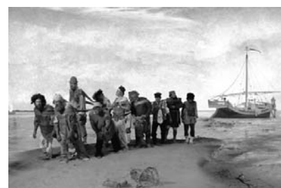
И.Е. Репин «Бурлаки на Волге» Рис. 3

Протекание химической реакции изображено на рисунке: