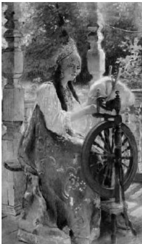
«За прялкой» Рис. 1

2.1. Из представленных ниже репродукций картин выдающегося русского художника К.Е. Маковского (1839 – 1915) выберите ту, на которой изображено протекание химической реакции.