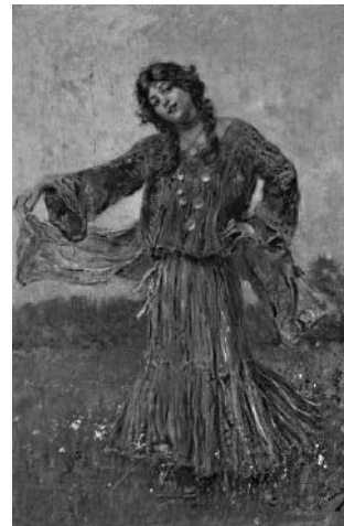
«Цыганка танцует» Рис. 3

Протекание химической реакции изображено на рисунке: