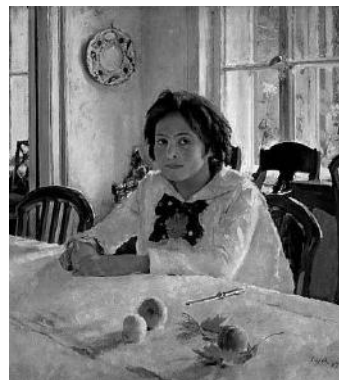
В.А. Серов «Девочка с персиками» Рис. 3

Протекание химической реакции изображено на рисунке: