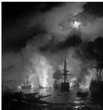
И.К. Айвазовский «Чесменский бой» Рис. 2