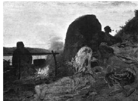
«Бурлаки у костра» Рис. 3

Протекание химической реакции изображено на рисунке: