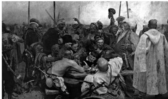
«Запорожцы пишут письмо турецкому султану» Рис. 2