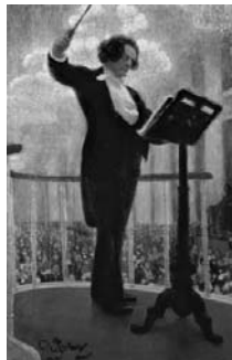
«Портрет А.Г. Рубинштейна» Рис. 1

2.1. Из представленных ниже репродукций картин выдающегося русского художника И.Е. Репина (1844 – 1930) выберите ту, на которой изображено протекание химической реакции.