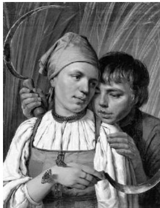
Алексей Венецианов «Жнецы»

2.1. Из представленных ниже репродукций картин выдающихся русских художников выберите ту, на которой изображено протекание химической реакции.