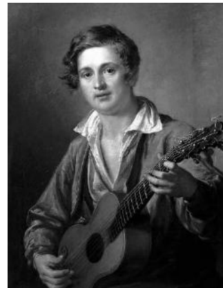
Василий Тропинин «Гитарист»