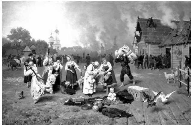
Николай Дмитриев-Оренбургский «Пожар в деревне»